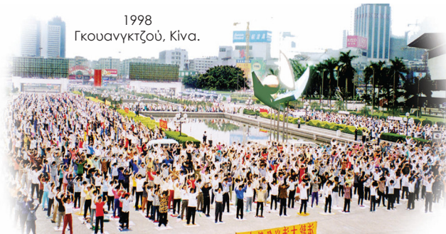
1998 Γκουανγκτζού, Κίνα.