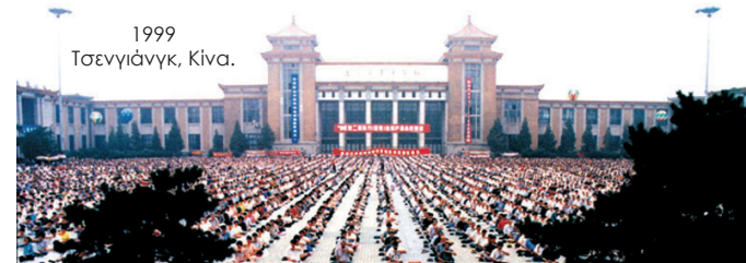
1999 Τσενγιάνγκ, Κίνα.

Το Φάλουν Ντάφα δημοσιοποιήθηκε για πρώτη φορά στην Κίνα το 1992 από τον κ. Λι Χονγκτζι . Χάρη στα θαυμαστά οφέλη της στην σωματική και ψυχική υγεία, πολύ γρήγορα η μέθοδος διαδόθηκε από στόμα σε στόμα και απέκτησε δεκάδες εκατομμύρια ασκούμενους .