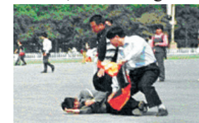
Zivilpolizisten überwältigen einen Praktizierenden auf dem Platz des Himmlischen Friedens

• Die Verfolgung ist irrational – das Verbot war reine Willkür des ehemaligen Präsidenten Jiang Zemin, man vermutet Neid und Angst vor der großen Anzahl der Falun Gong-Praktizierenden, die Anfang 1999 die Anzahl der Parteimitglieder um ca. 20 Millionen überstieg. Viele Mitglieder der kommunistischen Partei waren gegen die Verfolgung.