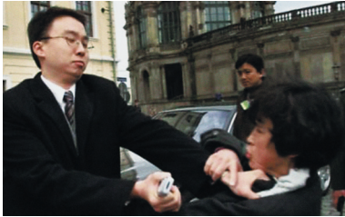
2002 beim Besuch von Jiang Zemin in Deutschland: Ein chinesischer Sicherheitsbeamter drückt einer Frau die Kehle zu, weil sie „Falun Gong ist gut“ gerufen hatte.

Während des Staatsbesuchs von Jiang Zemin in Deutschland im April 2002 verboten deutsche Sicherheitskräfte das Tragen der Farbe Gelb in Sichtweite des Staatsgastes. Jiang hatte gedroht, angesichts der Farbe Gelb (der Farbe von Falun Gong) auf den Straßen würde er sofort abreisen.